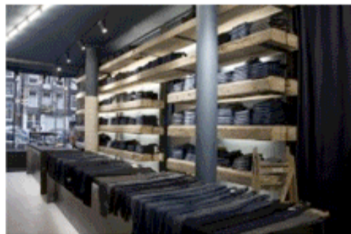
Tenue de Nîmes in Amsterdam

"Wij claimen voor iedereen een passende spijkerbroek te hebben. Van denimfetisjist tot moeder van drie kinderen."